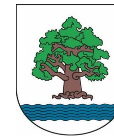
Konstancin - Jeziorna